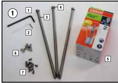
Item-No: 1 DE-116 2 LI-123 3 OC-105 4 OC-106 5 8-523 6 PLD-111 7 LI-217